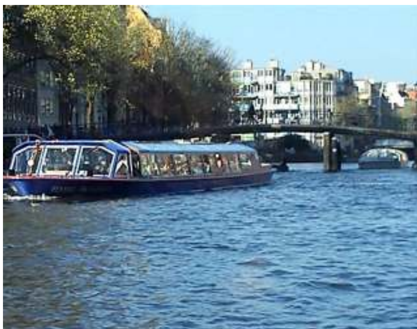
Kanaltur i Amsterdam

När de byggdes, så skattades de efter hur breda de var mot kanalen. Därför är husen mycket långsmala framifrån, men desto djupare! I.o.m. att de är så smala så är det svårt (nästan omöjligt) att få upp möblerna på övervåningarna, så varje hus har en krok högst upp på fasaden. Med hjälp av den hissar de upp och ner möblerna vid flyttningar och nya möbelköp.