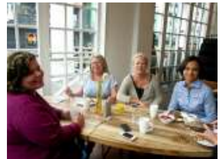
Frukost på hotellet