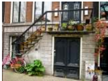
Amsterdam är Nederländernas största stad och har ca 8 ½ miljoner invånare.

Konferensen avslutades först med att stafettpippen gick vidare till Zurich som ska vara värdland för nästa nätverkskonferens 2016 och därefter med en gemensam lunch på hotellet.