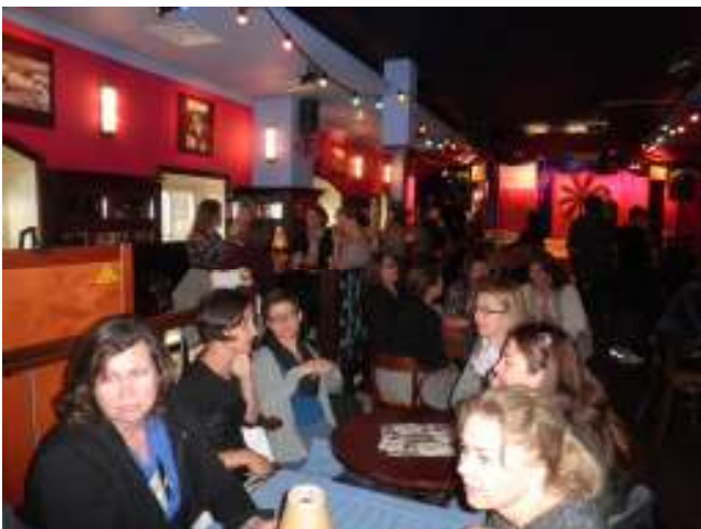
Restaurang Kapten Zeippos

När sedan varmrätterna kom, smakade köttet skosula och laxen var halvrå. Kanske är vi bortskämda här på Cypern? Men desserten var som tur desto godare med goda kakor.