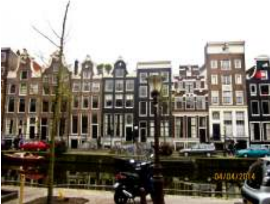
De smala men höga husen utefter kanalerna

Efter den fantastiska kanalturen promenerade vi till restaurang Kapitein Zeppos, där vi bjöds på middag. Efter en lång väntan blev salladsbuffén framdukad och tog slut på ett nafs. Så där står vi 30 personer kvar, med kurrande magar och väntar och väntar. Långt om länge kom då äntligen påfyllningen. Restaurangägaren tyckte vi åt för mycket! Vet inte hur mycket 60 kvinnor och 2 män kan äta per man, men det var visst alldeles för mycket enligt holländarna ;-)