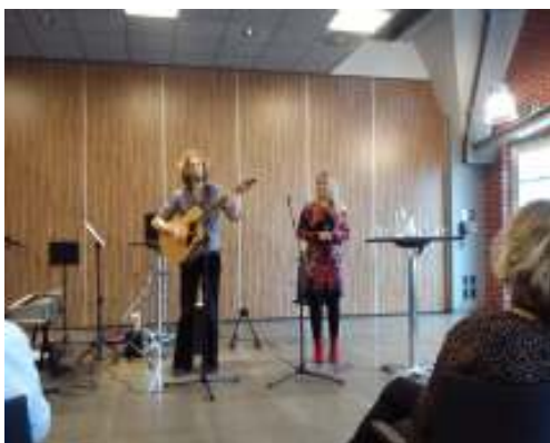
Härlig Vreeswijk musik av gruppen De Andersons

Åsa visade oss hur vi bäst kan värma upp stämbanden före en lektion för att få auktoritet och kraft i rösten.