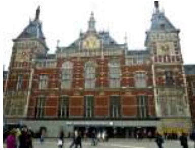
Stora pampiga Amsterdam Centraal från 1889. Här passerar ca 250 000 tågresenärer varje dag.

Grupp två, latmaskarna, som hade sitt eget lilla hundäventyr på resan, men ändå hann med en del bl.a. hälsade vi på drottning Silvia och kungen som var på statsbesök, besökte Red Light District, provsmakade goda ostar och intog en god middag i trevligt sällskap.