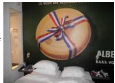
Hotellrummet som hade fönster in till badrummet gav oss många goda skratt.